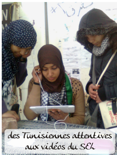
des Tunisiennes attentives aux vidéos du SEL