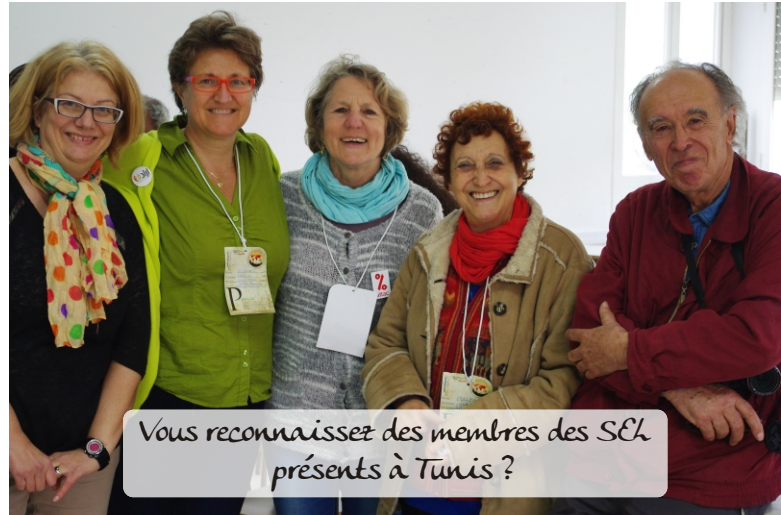
Vous reconnaissez des membres des SEL présents à Tunis ?

Petits Débrouillards de Nantes, présents à Tunis, et ceux de Brest, nous avons participé à une vidéo-conférence avec le café "le 54" le mercredi soir. Initiée par les Petits Débrouillards, cette rencontre a réuni une trentaine de personnes à Brest, représentant des associations comme le Collectif pour la Transition Citoyenne, Court-Circuit, Incroyables comestibles... Sur place, une multitude de conférences et ateliers. Nous avons assisté à certaines sur les thèmes suivants :