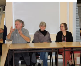
Un temps de partage et de convivialité